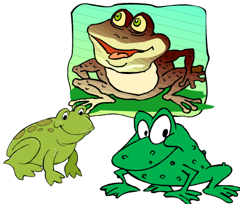
La Grenouille Page 6