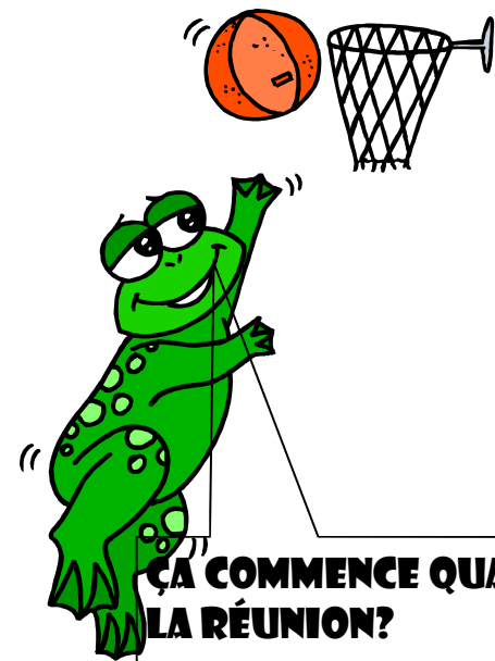
La Grenouille Page 7