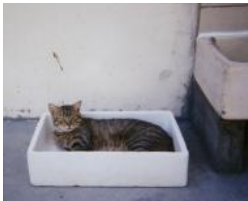
Photo du chat

Suite à la parution de cette photo dans voici (gala l'a refusée) voici la réaction de nos lecteurs :